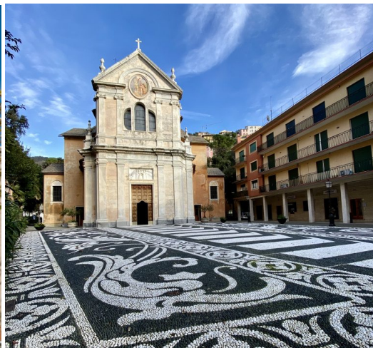
Chiesa di Zoagli