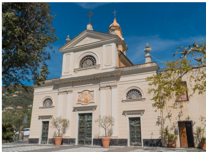
Chiesa di Sant' Ambrogio