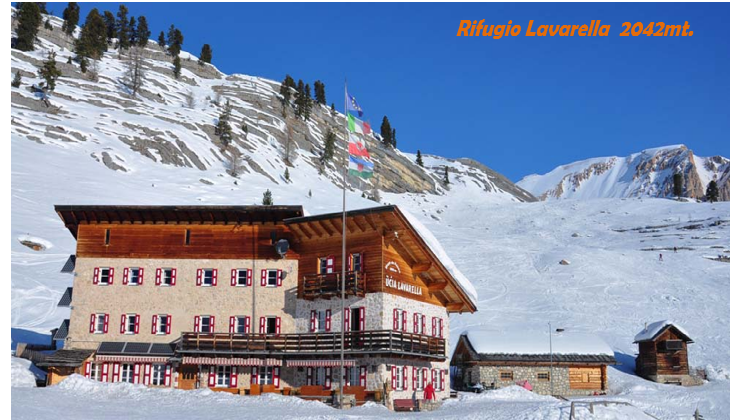
Rifugio Lavarella 2042mt.