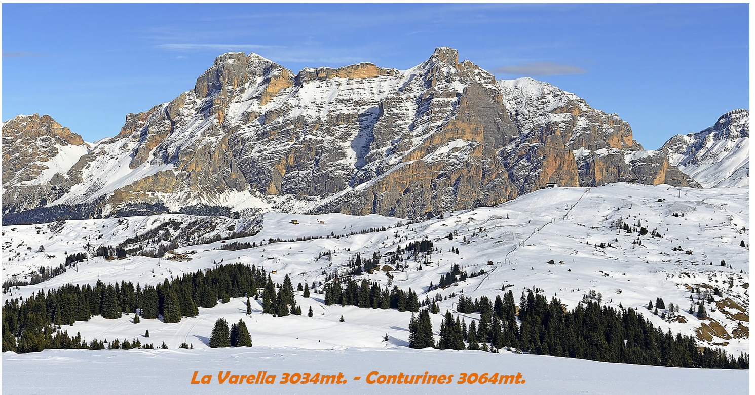
La Varella 3034mt. - Conturines 3064mt.