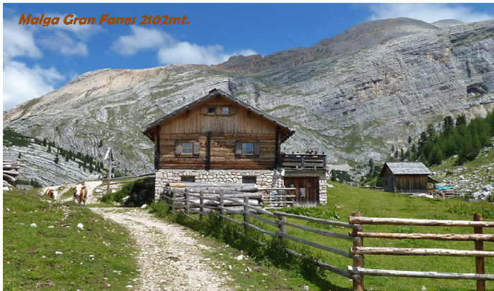
Malga Gran Fanes 2102mt.